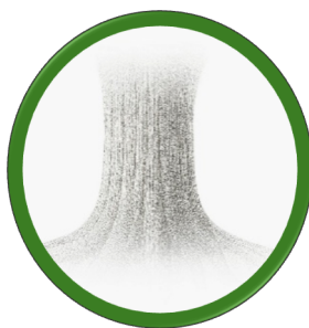
Árbol - I°Y II° Medio