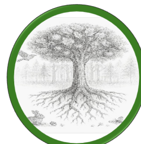
Bosque - III°Y IV° Medio

Los niveles de 7° a III medio se organizan en multigrados con estudiantes de dos niveles cada uno. Ingresan a las 8:30 hrs. Y salen 3 días a la semana a las 14:00 hrs. Y 2 días a las 16:00 hrs.