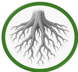
Raíz - 1°y2° básico