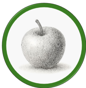
Fruto -7°y8° básico

Las clases complementarias cuentan con 1 profesor/a, y en el caso de 1° y 2° en todas sus asignaturas los acompañan alguna profesora tutora. Estas asignaturas son; música, movimiento, e inglés. Se trabaja en coordinación de 1° a 6° básico, con una proyección de habilidades y conocimientos individuales y grupales para ir avanzando en forma articulada y orgánica.