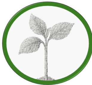
Brote - 3°y 4° básico